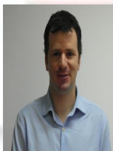
PEDRO COSTA PRESIDENTE